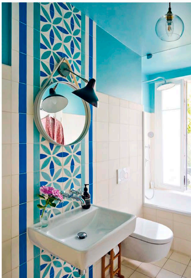
Ci-contre: La salle de bains bleue. C'est celle d'Eva car elle ouvre sur son dressing.

Majoritairement d'apparence rétro ou bien chinés, meubles et accessoires cohabitent avec des éléments plus contemporains aux lignes radicales. Beaucoup de mobilier intégré en bois a été conservé. Pour apporter du relief, les boiseries dans la salle à manger ont été peintes dans des tons crème, ces dernières contrastent délicatement avec le bleu tendre de la cuisine. Véritable source d'inspiration pour le couple, les moulures et parquets d'époque de la maison cohabitent avec quelques icônes du design, des pièces de la première partie du XXe siècle ou des œuvres plus actuelles. Un mix and match qui joue les duettistes, proposant des contrastes singuliers afin de mettre en valeur l'existant. La maison devient, au fil des étages, une bulle de détente hors du temps, parfois bohème, parfois contemporaine. Les styles s'y mélangent, ramenant de l'authenticité par endroits, bousculant les codes ailleurs. Sans perdre de sa poésie, tout l'espace ici se voit exploité, optimisé, réinventé avec raffinement et délicatesse. Pari gagné. ■